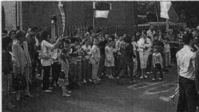
Druento, grande partecipazione dei piccoli