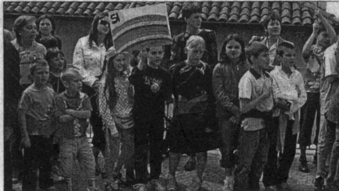
Givoletto, i bambini delle scuole