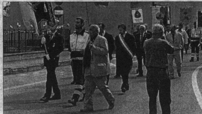
La Cassa, il corteo