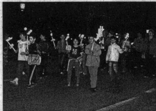
San Gillio, la fiaccolata